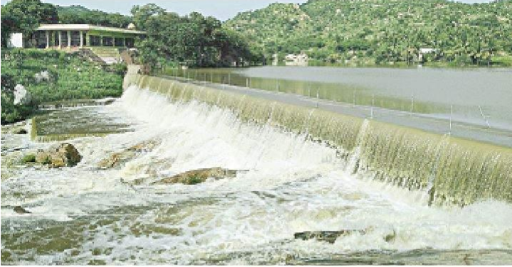
தமிழக-ஆந்திர எல்லையான புல்லூர் தடுப்பணை நிரம்பி பாலாற்றில் ஏற்பட்ட வெள்ளம்

தமிழக-ஆந்திர மாநிலத்தில் தொடர் கனமழை: பாலாற்றில் வெள்ளம்