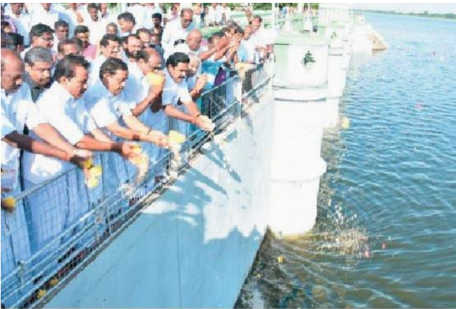
கல்லணையிலிருந்து காவிரியில் தண்ணீர் திறந்துவிட்ட பிறகு மலர் தூவும் அமைச்சர்கள் உள்ளிட்டோர்.