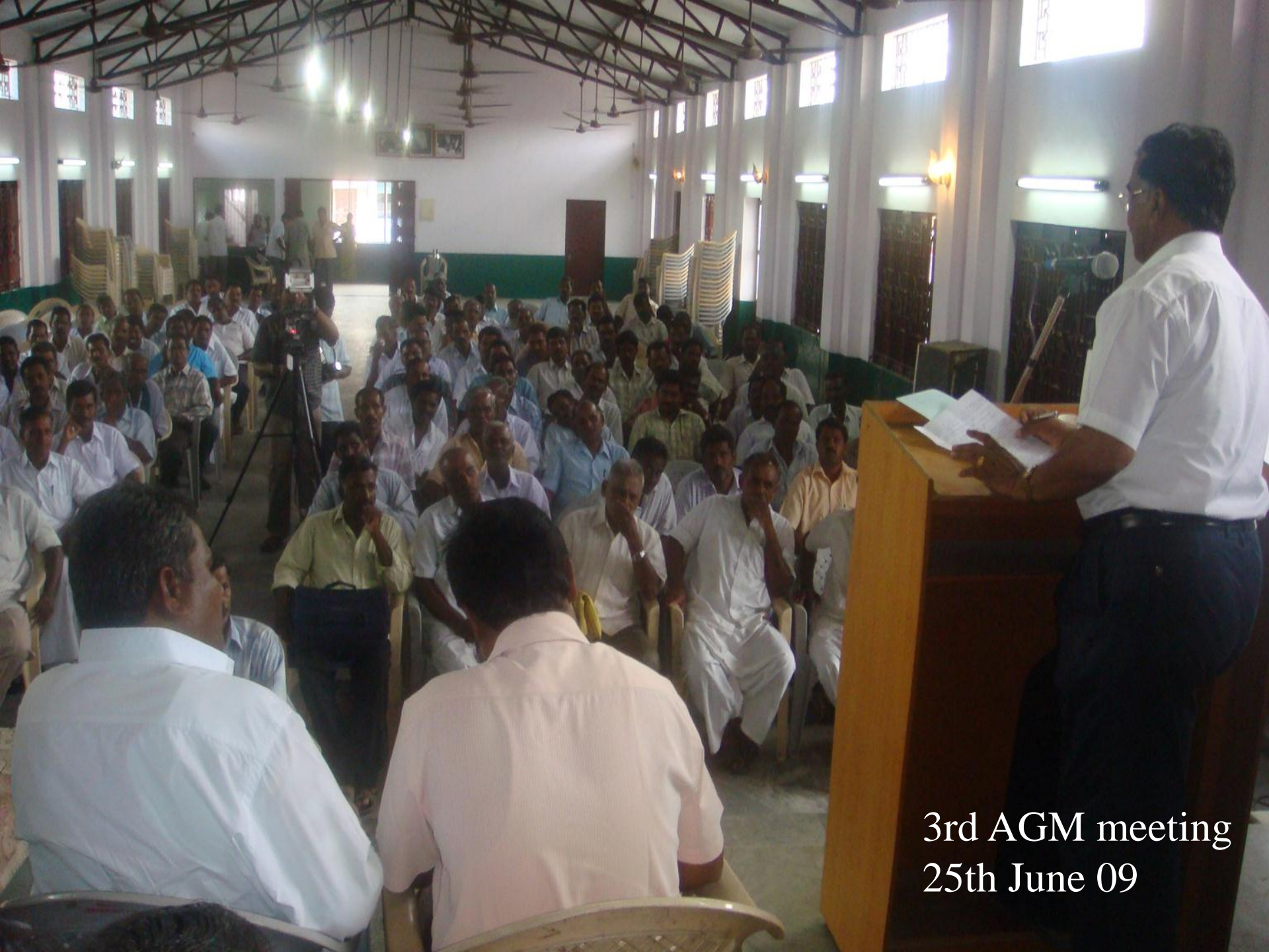
3rd AGM meeting 25th June 09