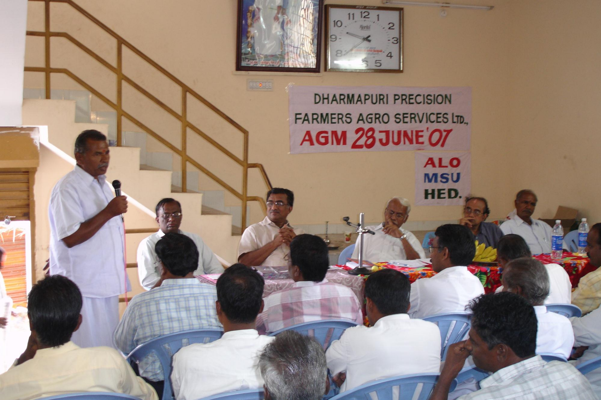
First AGM Meet 28 th June 2007