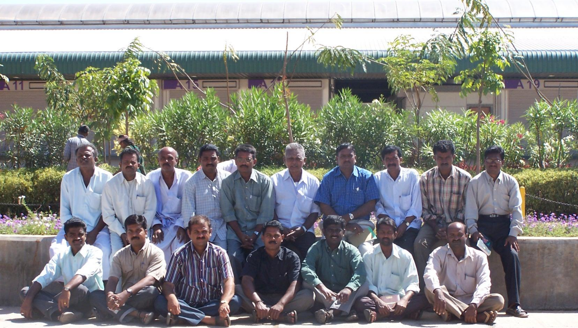
Farmers at SAFAL Market , Bangalore