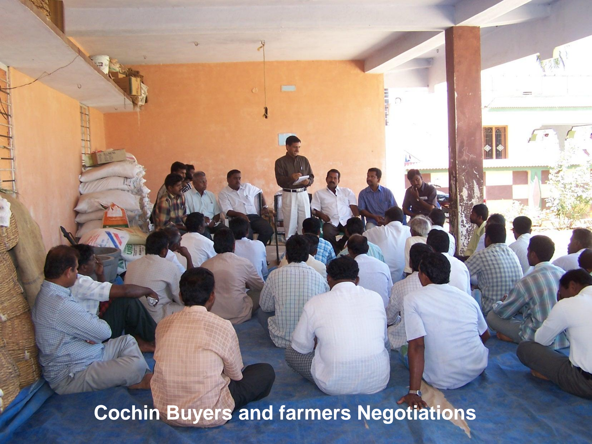
Cochin Buyers and farmers Negotiations