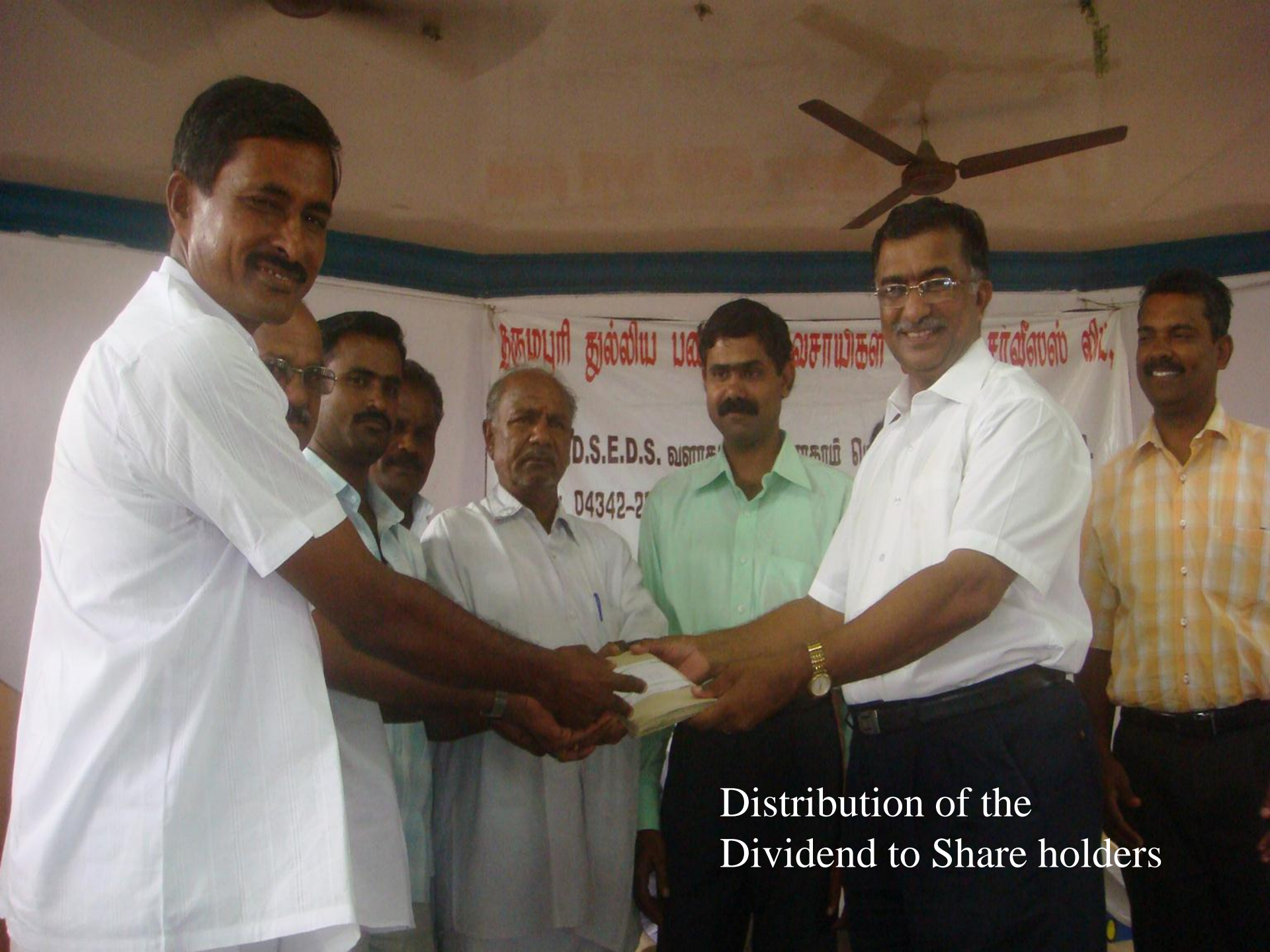
Distribution of the Dividend to Share holders