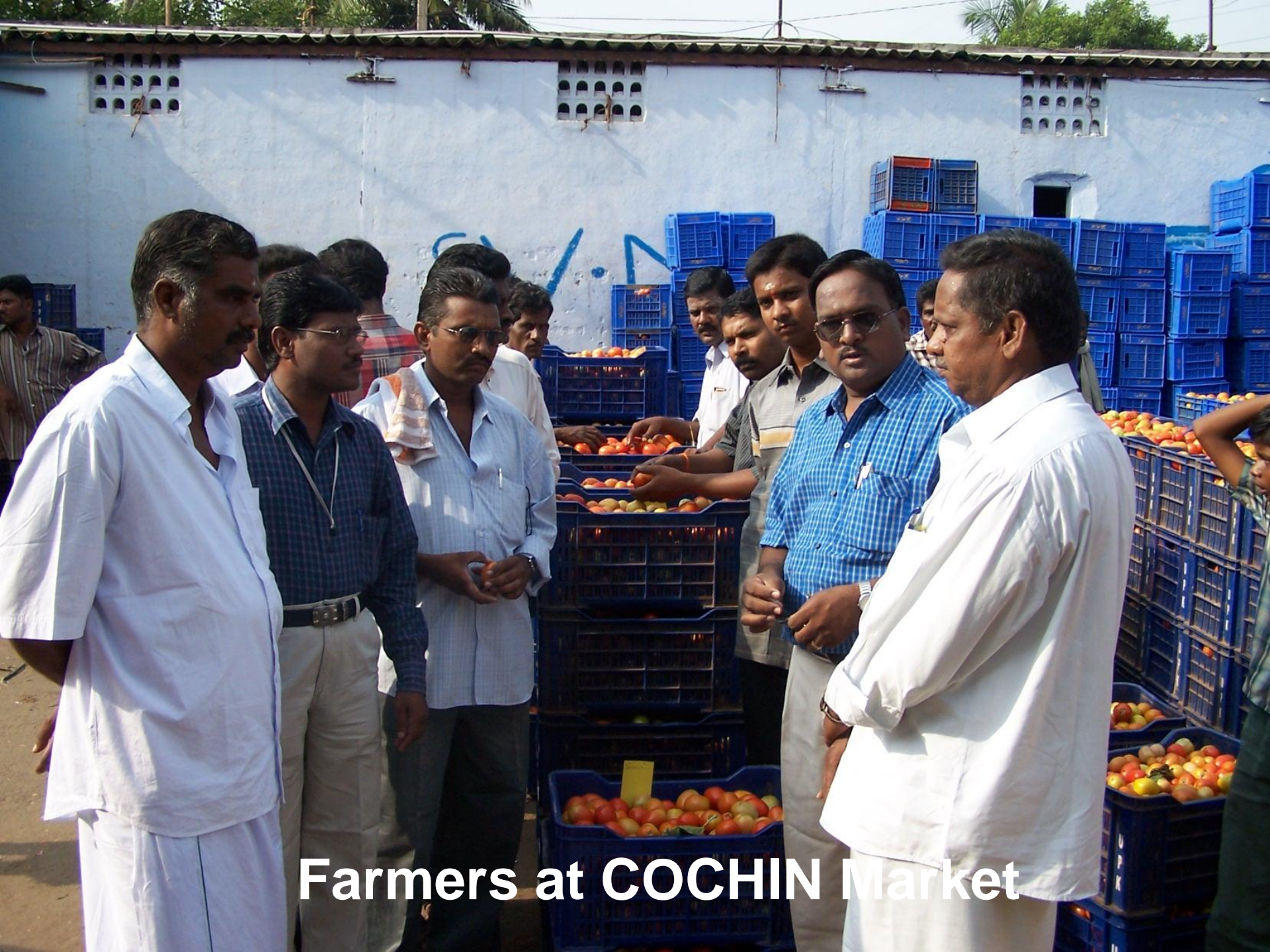
Farmers at COCHIN Market