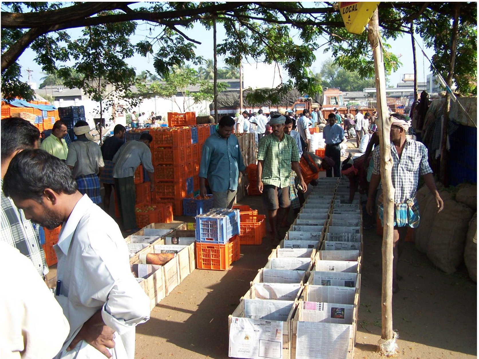
Farmers at Coimbatore Vegetable Market