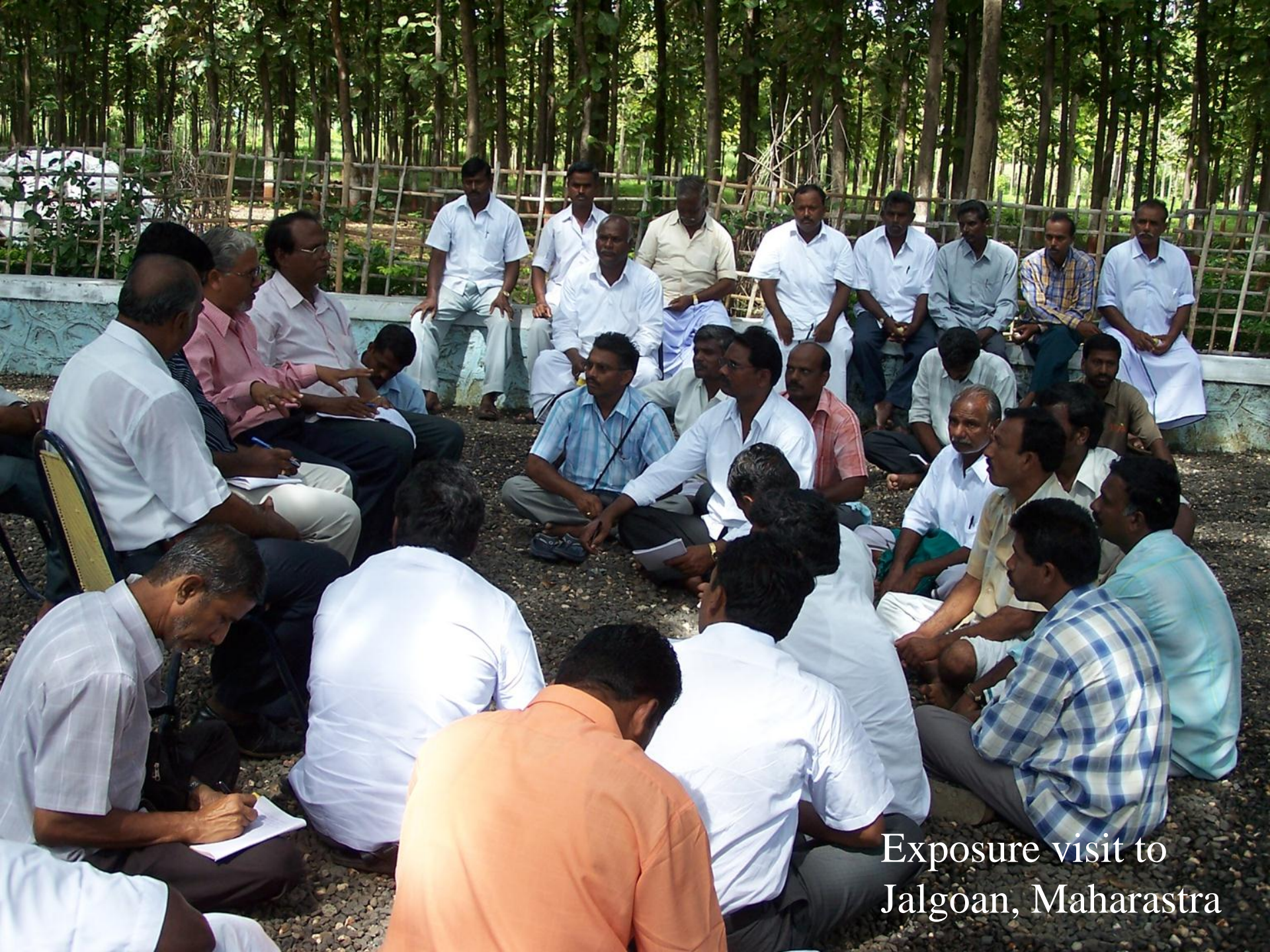
Exposure visit to Jalgoan, Maharashtra