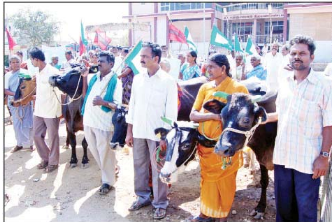
சூலூர் தாலுகா அலுவலகம் எதிரே பால் உற்பத்தியாளர்கள் கறவை மாடுகளுடன் நூதன போராட்டத்தில் ஈடுபட்ட போது எடுத்த படம்.

பால் கொள்முதல் விலையை உயர்த்தக்கோரி சூலூரில், கறவை மாடுகளுடன் பால் உற்பத்தியாளர்கள் போராட்டம்