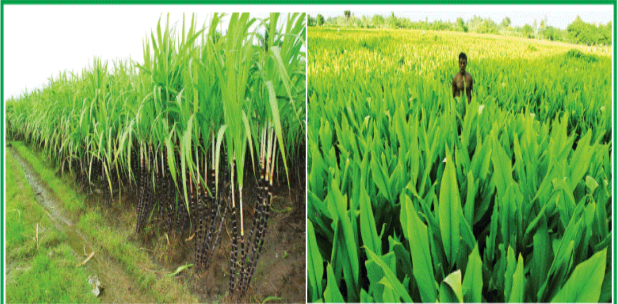
நாங்க ரெய்; நீங்க ரெய்யா?: பொங்கல் பண்டிகைக்கு சில தினங்களே உள்ள நிலையில் விழுப்புரம் மாவட்டத்தில் அறுவடைக்கு தயாராக காத்திருக்கும் கரும்பு மற்றும் மஞ்சள் பயிர்கள்.