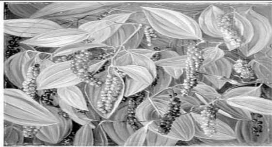
கிராம் கார்போயிபுரான் மருத்தை இட்டு கொடிகளை நடவு செய்ய வேண்டும்.

மிளகுப்பயிர் நடும் குழிகளில் 15 கிராம் போரேட் அல்லது 30