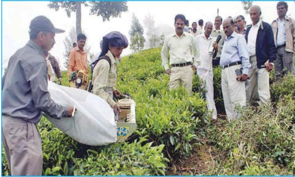
சிறு விவசாய சங்க உறுப்பினர்களுக்கு எந்திரத்தின் உதவியுடன் இலை பறித்தல் குறித்து செயல் விளக்கம் அளிக்கப்பட்ட காட்சி.

நீலகிரி மாவட்டத்தில் உள்ள சிறு விவசாய சங்கங்கள் ஒன்றிணைந்து செயல்பட வேண்டும் தேயிலை வாரிய செயல் இயக்குனர் வேண்டுகோள்