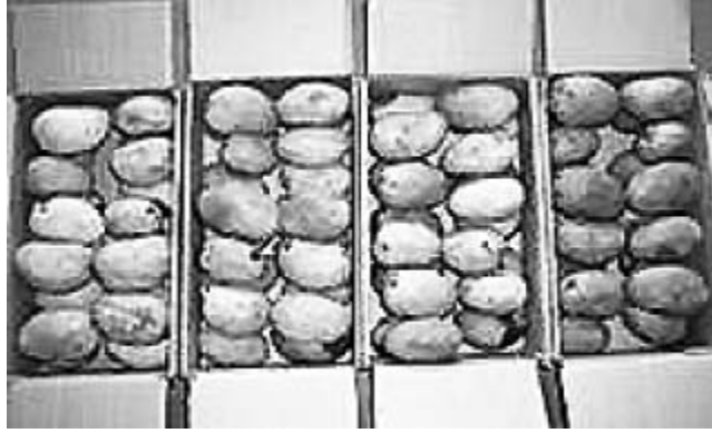
பயோகோட்டிங் செய்யப்பட்ட மாம்பழங்கள்.

First Published : 16 Jun 2011 12:03:32 AM IST