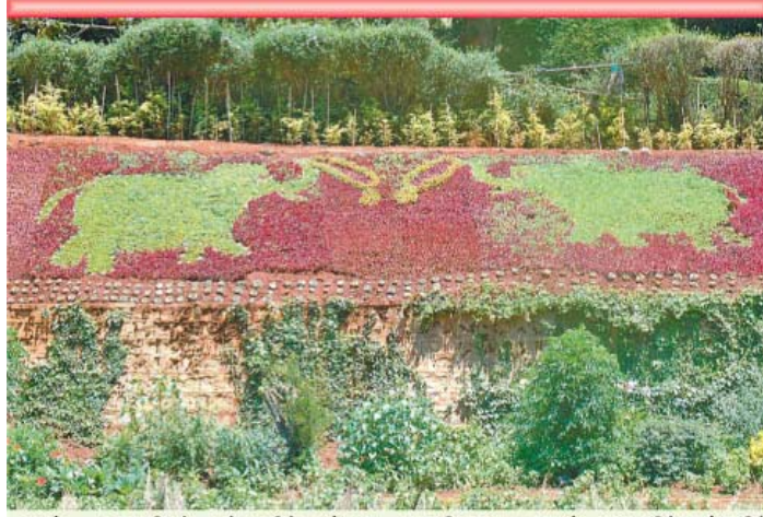
ஊட்டி தாவரவியல் பூங்காவில் சுற்றுலா பயணிகளை கவரும் வகையில் புற்களில் வடிவமைக்கப்பட்டுள்ள மாலையிடும் யானைகளை படத்தில் காணலாம்.