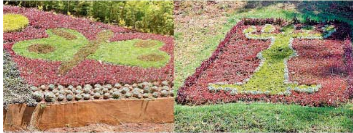
புற்களில் வடிவமைக்கப்பட்டுள்ள பட்டாம்பூச்சி மற்றும் குத்துவிளக்கு.

எப்போதும் இத்தாலியன் கார்டன் மேடான பகுதியில் மட்டும் வடிவமைக்கப்பட்டு இருந்த, இந்த அலங்காரங்கள் தற்போது, அதற்கு மேல் உள்ள கண்ணாடி மாளிகைக்கு செல்லும் வழியிலும் அமைக்கப்பட்டு இருக்கிறது.