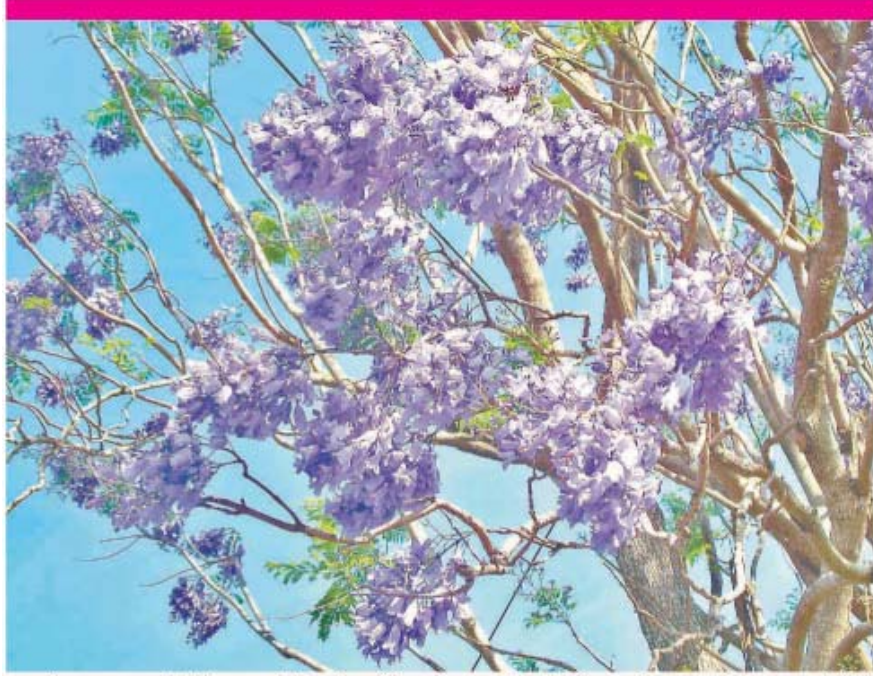
மசினகுடி பகுதியில் சாலையோரங்களில் பூத்து குலுங்கும் ஜெகரண்டா மலர்களை படத்தில் காணலாம்.