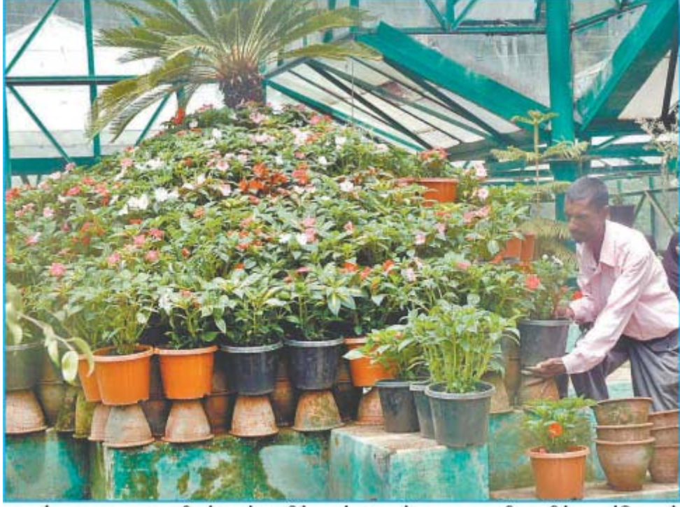
ஊட்டி அரசு தாவரவியல் பூங்காவில் உள்ள கண்ணாடி மாளிகையில் மலர்செடிகள் அடுக்கும் பணியில் ஊழியர் ஈடுபட்டுள்ள காட்சி.

அரசு தாவரவியல் பூங்காவில், சீசனை முன்னிட்டு கண்ணாடி மாளிகையில் மலர்செடிகள் அடுக்கும் பணி தீவிரம்