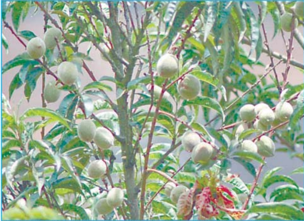
ஊட்டி அருகே ஒரு விவசாய தோட்டத்தில் பிச்சீஸ் பழங்கள் மரத்தில் காப்த்து குலுங்குவதை படத்தில் காணலாம்.

நீலகிரி மாவட்டத்தில் பிச்சீஸ் பழ சீசன் தொடக்கம்