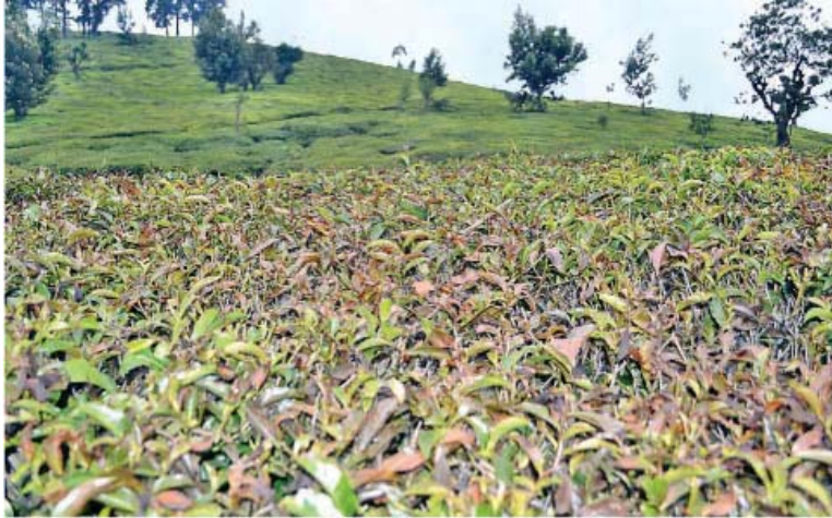
கொலக்கம்பை பகுதியில் நிலவி வரும் கடும் உறை பனியால் தேயிலை செடிகள் கருகி உள்ளதை படத்தில் காணலாம்.