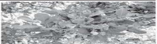
நடவுக்கு முன் எக்ஸ்ட்ரூக்ட் 12 டன் தொழு உரம் இடும் நிலத்தை பண்படுத்த வேண்டும். பின்னர் 45 செ.மீ. நீளம், அகலம், ஆழமுள்ள குழிகளை 5x4 மீட்டர் இடைவெளியில் எடுக்க வேண்டும்.

சுற்றுநீர் ஈரப்பதம் 90 சதவீதத்திற்கு மேல் இருந்தால் நல்ல பூ, காய்ப்பிடிப்பு, விளைச்சலை பெற முடியும். பருவமழை காலங்களில் 3 மாத வயதுடைய ஒட்டுக்கன்றுகளை நடவு செய்வது நல்லது.