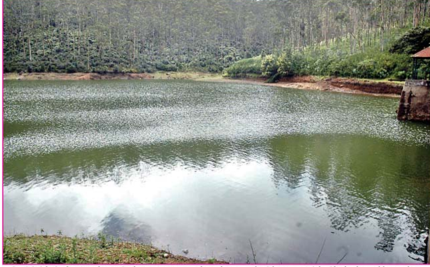
நீலகிரியில் பெய்து வரும் வடகிழக்கு பருவமழையால் ஊட்டி டைகர்லில் அணையின் நீர்மட்டம் உயர்ந்து உள்ளதை படத்தில் காணலாம்.

நீலகிரி மாவட்டத்தில் பருவமழை காரணமாக வேகமாக நிரம்பும் அணைகள் மின் உற்பத்தி அதிகரிப்பு