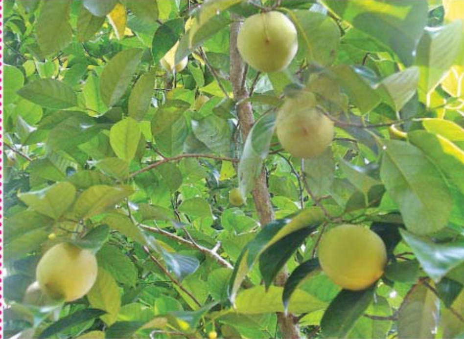
கொலக்கம்பை பகுதியில் உள்ள ஒரு விவசாயியின் தோட்டத்தில் காய்த்து குலுங்கும் ஜாதிக்காய்களை படத்தில் காணலாம்.

இந்த காய்களை வாங்கி செல்லும் பெரும்பாலான மக்கள் ஊறுகாய் தயாரிக்க பயன்படுத்தி வருகின்றனர். அரசு தோட்டக்கலைப்பண்ணையிலும் இதுபோன்று ஜாதிக்காய்களை பறித்து உறுகாய் தயாரித்து வருகின்றனர். இதனை பொதுமக்கள் மற்றும் கற்றுலா பயணிகள் அதிகளவு வாங்கி செல்கின்றனர். இந்த ஆண்டு ஜாதிக்காய் மகசூல் அதிகமாக உள்ளதாலும், நல்ல விலை கிடைப்பதாலும் விவசாயிகள் மகிழ்ச்சி அடைந்து உள்ளனர். மேலும் ஜாதிக்காய் விற்பனை மூலம் தங்களுக்கு இந்த ஆண்டு ஓரளவு வருமானம் கிடைத்து உள்ளதாக அவர்கள் தெரிவித்தனர்.