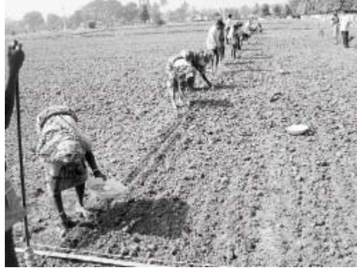
நேரடி புழுதி நெல் விதைப்பு பணி.

First Published : 02 Aug 2012 12:20:29 AM IST