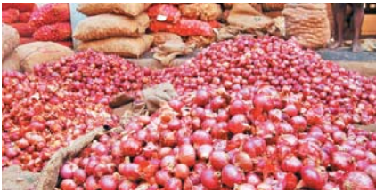
புதுடெல்லி: வெங்காயம் விளைச்சல்

அதிகரித்துள்ளதால் மகாராஷ்டிரா மாநிலத்தில் ஒரு கிலோ ரூ.10க்கு விற்கப்படுகிறது. இதற்கிடையே, ஏற்றுமதிக்கான குறைந்தபட்ச விலையை 800 டாலர், 350 டாலர் என்றும் மத்திய அரசு குறைத்தது. இந்நிலையில், வெங்காய