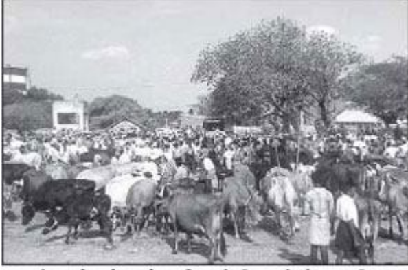
குண்டடம் சந்தைக்கு கொண்டு வரப்பட்ட மாடுகளை படக்கில் காணலாம்.