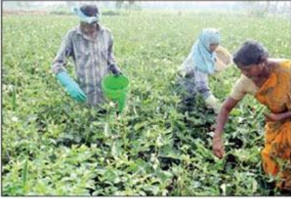
பி.பி.அக்ரஹாரம் அருகே சமயசங்கிலியில் உள்ள

பப்பாளி- வெண்டைக்காய் விளைச்சல் அமோகம் விவசாயிகள் மகிழ்ச்சி