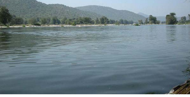
சென்னை : கருமேனியாறு-நம்பியாறு

நதிநீர் இணைப்பு திட்டத்தின் மூலம் அமைக்கப்பட்டு வரும் கால்வாய் பணிகளுக்காக நிலத்தை கையகப்படுத்த பொதுப்பணித்துறைக்கு அரசு உத்தரவிட்டுள்ளது. நெல்லை மாவட்டம் தாமிரபரணி ஆற்றின் உபரி நீரை சாத்தான் குளம், திசையன்விளை போன்ற வறண்ட பகுதிகளுக்கு கொண்டு செல்வதற்காக கடந்த 2007ல் திமுக ஆட்சிக்காலத்தில் தாமிரபரணி-கருமேனியாறு-நம்பியாறு நதிகள் இணைப்பு திட்டம் தீட்டப்பட்டது. இதற்காக தாமிரபரணி ஆற்றின் குறுக்கே கட்டப்பட்டுள்ள கன்னடியன் அணைக்கட்டில் இருந்து, 6.50 கி.மீ வரை கால்வாயின் தண்ணீர் கடத்தும் திறனை அதிகப்படுத்தியும், அங்கிருந்து எம்பால் தேரி வரை 73 கி.மீ நீளத்திற்கு புதிதாக வெள்ளநீரை எடுத்து செல்லும் விதமாக கால்வாய் ஒன்றை அமைக்கவும் முடிவு செய்யப்பட்டது.