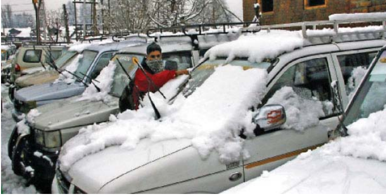
ஸ்ரீநகர்: காஷ்மீரில் கடந்த 40

நாட்களாக கடுமையான பனிப் பொழிவு இருந்தது. அதனால், சாலைப் போக்குவரத்து பாதிக்கப்பட்டது. மக்களின் இயல்பு வாழ்க்கையும் முடங்கியது. அத்தியாவசியப் பொருட்கள் சப்ளையும் பாதிக்கப்பட்டது. தற்போது இரவில் மட்டும் கடும் குளிர் நிலவுகிறது. நேற்று பகலில் சிறிது நேரம் வெயில் அடித்தது. தலைநகர் ஸ்ரீநகரில் இரவில் குறைந்தபட்சமாக 3.6 டிகிரி செல்சியஸ் பதிவானது, நேற்று முன்தினம் இரவு 3.5 டிகிரி செல்சியஸ் பதிவானது. பகலில் சிறிது குளிர் குறைந்துள்ளது. அதே போன்று காஷ்மீரின் தென் பகுதியில் 9.0 டிகிரி செல்சியஸ் பதிவானது.