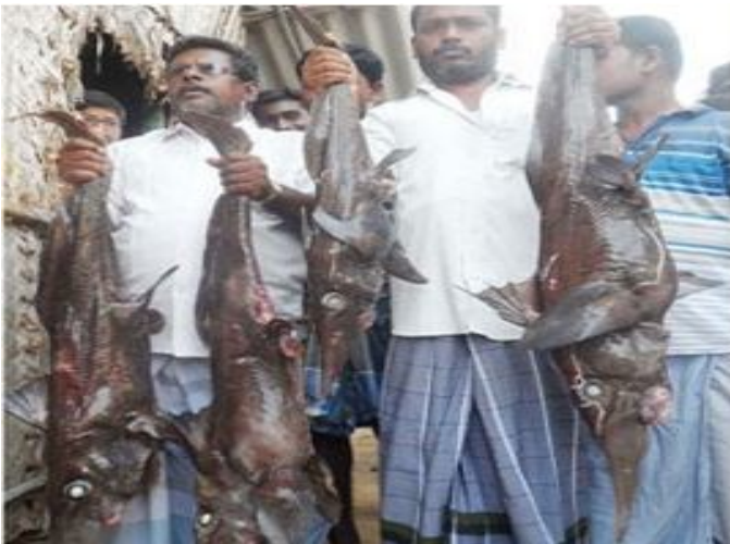
வலையில் சிக்கிய அரிய வகை லோப் மீன்களுடன் பாம்பன் மீன்வர்கள்.