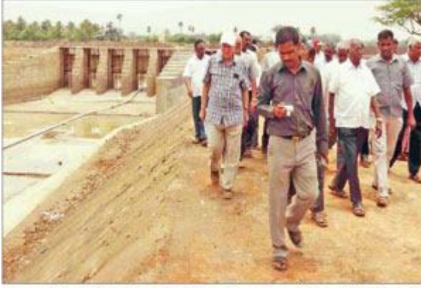
வைகை-கிருதுமால் இணைப்பு கால்வாய்திட்ட பணிகளை உலக வங்கி குழுவின் பார்வையிட்டு ஆய்வு செய்த போது எடுத்த படம்.

ரூ.13 கோடி மதிப்பிலான கிருதுமால் நதி இணைப்பு திட்டம்; உலக வங்கி குழு ஆய்வு