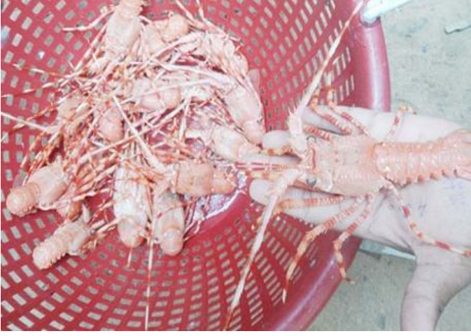
வலையில் சிக்கிய சிங்கி மீன்கள்.