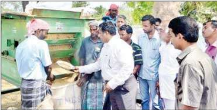
விற்குமையில் உள்ள நேரடி நெல் கொள்முதல் நிலையத்தில் கலெக்டர் பழனிசாமி ஆய்வு செய்தபோது எடுத்தபடம்.