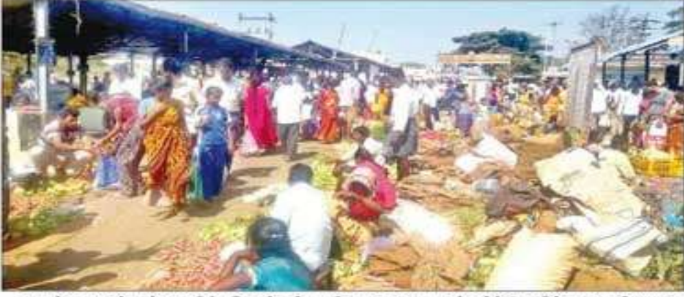
ஓசூர் உழவர் சந்தையில் பொங்கல் பண்டிகையை முன்னிட்டு விற்பனை ஜோராக நடைபெற்றபோது எடுத்த படம்.

ஓசூர் உழவர் சந்தையில் ஒரே நாளில் ரூ.17 லட்சத்துக்கு காய்கறி விற்பனை