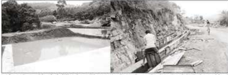
நம் அருவி அருகில் கட்டப்பட்டு உள்ள தடுப்பணையாகும். அதன் அருகே நீரை கொண்டு செல்ல வாய்க்கால் அமைக்கும் பணி நடைபெற்று வருவதையும் படத்தில் காணலாம்.

நம் அருவி நீரை தடுப்பணையில் சேமித்து விவசாயத்திற்கு பயன்படுத்த ஏற்பாடு பணிகள் தீவிரம்