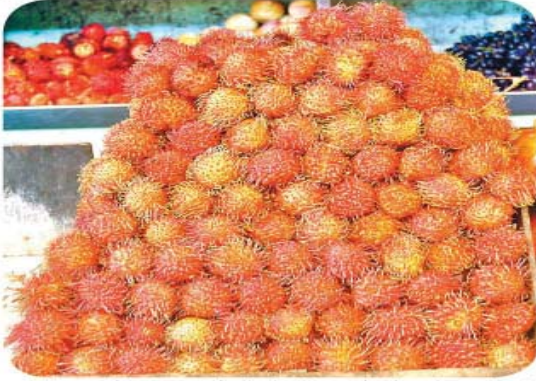
விற்பனைக்காக வைக்கப்பட்டுள்ள ரம்பூட்டான் பழங்கள்.