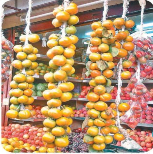
ஊட்டி மார்க்கெட்டில் விற்பனைக்காக தொங்க விடப்பட்டுள்ள பெர்சிமன் பழங்கள்.