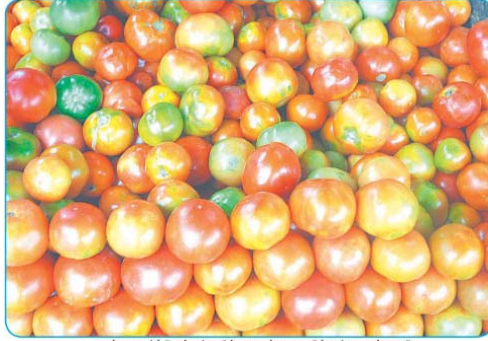
ஊட்டி மார்க்கெட்டில் விற்பனைக்கு குவிந்துள்ள தக்காளி.

ஊட்டியில், தங்கம் போல் உயரும் தக்காளி விலை