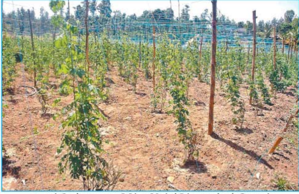
கூடலூர் தோட்டமூலா பகுதியில் பயிரிடப்பட்டுள்ள பாகற்காய் கொடிகள்.