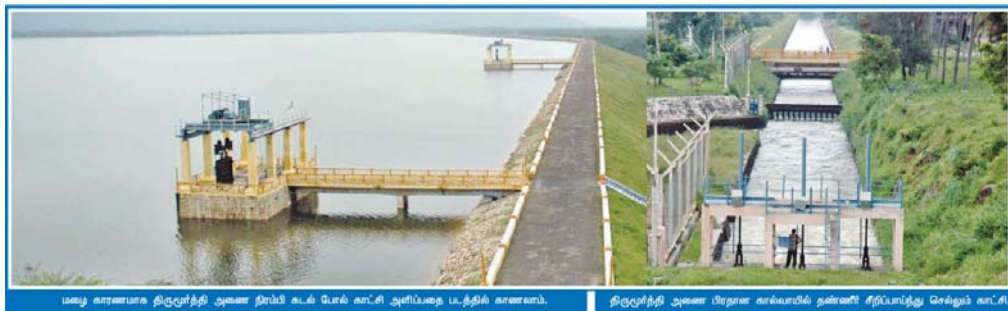
மது காணமாக திருமூர்த்தி அணை நிரம்பி கடல் மட்டம் காட்டி அளிப்பதை பத்தில் காணலாம்.