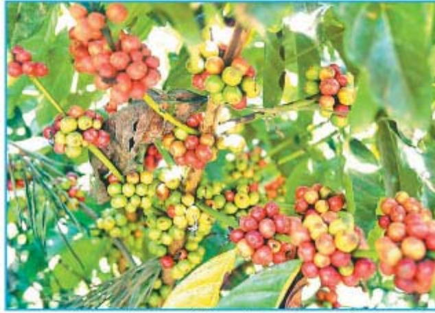
கூடலூர் பகுதியில் காபி செடியில் உள்ள காய்கள் பழுக்க தொடங்கி உள்ளதை படத்தில் காணலாம்.

மோசமான காலநிலையால் காபி விளைச்சல் பாதிக்கும் அபாயம்