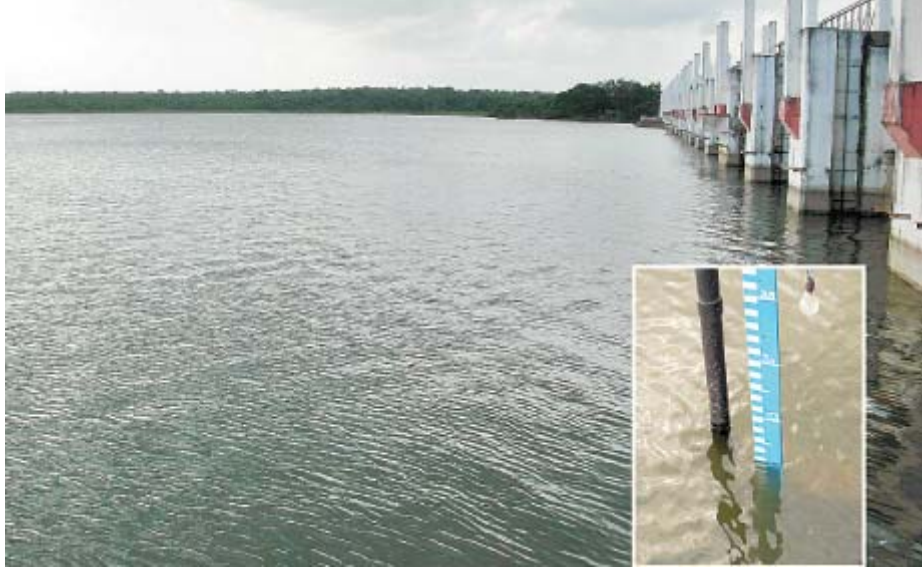
நிரம்பி வரும் பூண்டி ஏரி.

திருவள்ளூர். நவ. 17: சில நாள்களாக பெய்து வரும் பலத்த மழையின் காரணமாக சென்னைக்கு குடிநீர் வழங்கும் பூண்டி ஏரியின் நீர் மட்டம் கணிசமாக உயர்ந்து புதன்கிழமை காலை நிலவரப்படி 32.02 அடியாக உயர்ந்துள்ளது.