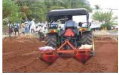
பார் எடுக்கும் கருவி