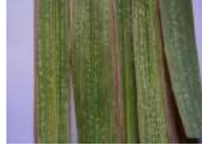
கரும்பு இலை சிலந்தி