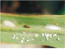
கரும்பில் பஞ்ச அசவிணி