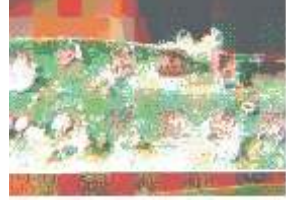
டை. பா ஊணுண்ணி