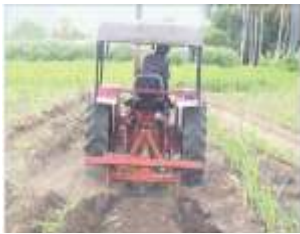
கரும்பு கட்டை சீவும் இயந்திரம்