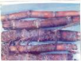
கரும்பில் செதில் பூச்சி