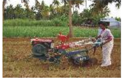
களை எடுக்கும் கருவி