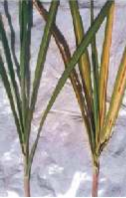
மஞ்சள் இலை நோய்