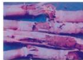
கரும்பில் கரையான் தாக்குதல்