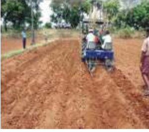
கரும்பு நடவு கருவி