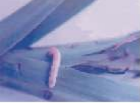
கரும்பில் நுனிக்குருத்துப் புழு