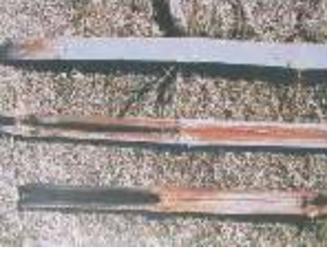
கரணை அழுகல் நோய்