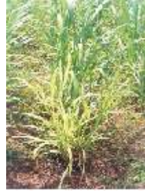
புல் தண்டு நோய்