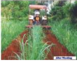
மண் அணைக்கும் கருவி