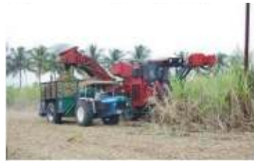
கரும்பு அறுவடை இயந்திரம்