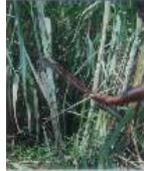
கரும்பு தோகை உரிக்கும் கருவி