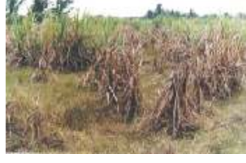
செவ்வழுகல் நோய் தாக்கிய வயல்