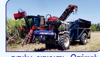
கரும்பு அறுவடை செய்யும் இயந்திரம்