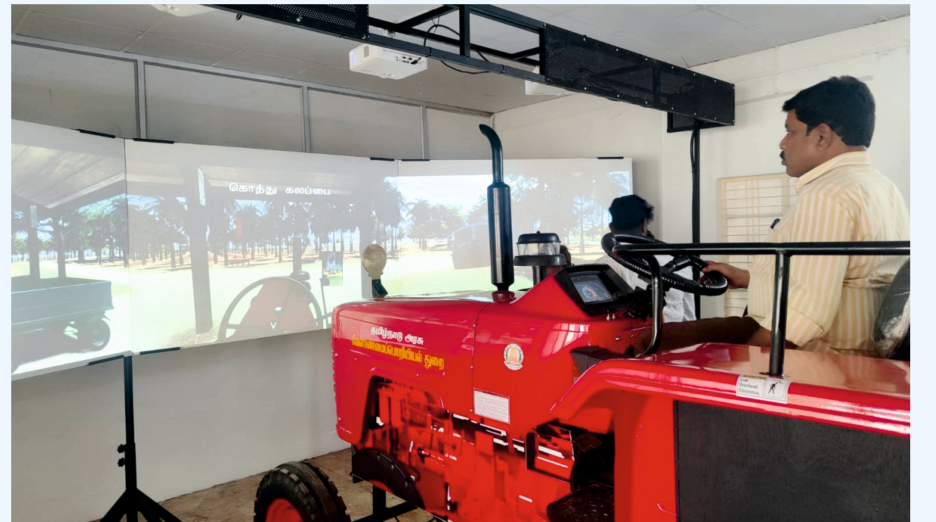
டிராக்டர் ஓட்டுவதற்கான பாவனை பயிற்சி சாதனம் (Tractor Simulator)