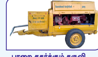
பாறை தகர்க்கும் கருவி