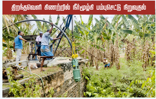
திறன்குறைந்த கிணற்றில் நீர்மூழ்கி பம்புசெட்டு நிறுவதல்

வேளாண்மையில், பயிர் உற்பத்தியை அதிகரிக்க, நிலத்தடி நீர் பாசனத்தில் மின் மோட்டார் பம்புசெட்டு மிக முக்கிய பங்கு வகிக்கிறது. திறன்குறைந்த மின் மோட்டார் பம்புசெட்டுகளை தொடர்ந்து பயன்படுத்துவதால், மின் நுகர்வு அதிகமாகி, பயிருக்கு நீர் பாய்ச்சுவதற்கான நேரமும் அதிகரிக்கிறது. மேலும், மின் மோட்டார்கள் வழக்கமான நேரத்தை விட அதிகமாக இயங்குவதால், அதிக வெப்பம் காரணமாக மோட்டாருக்கு சேதம் ஏற்படுவதோடு, மின்மாற்றியும் (டிரான்ஸ்பார்மர்) அதிக சூமை ஏற்றப்பட்டு சேதமடைகிறது.