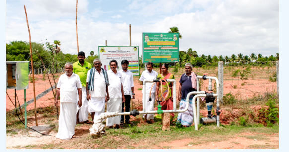
இனம் 1 - தொகுப்பில் உள்ள விவசாய குழுக்களுக்கு நீர் ஆதாரங்களை உருவாக்குதல்