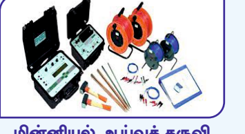
மின்னியல் ஆய்வுக் கருவி