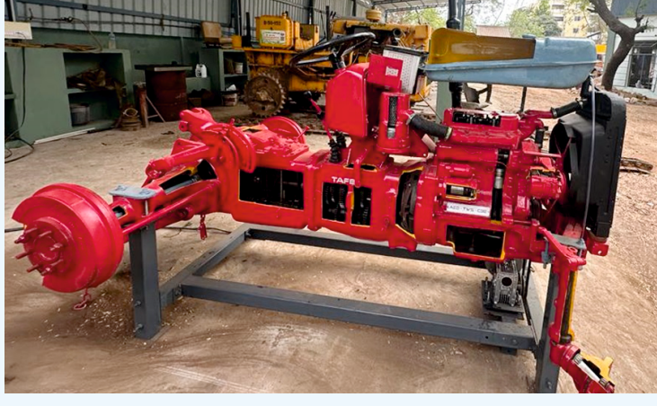
டிரா஁்டரி஁ன் வெ஁ட்ரூத் தூறுறு ஡ாதிரி (Tractor Cut Section Model)