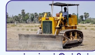
மண் தள்ளும் இயந்திரம்

சிறுபாசனத் திட்ட இயந்திரங்களுக்கு தேவையான எரிபொருள் (டீசல்), வேலையாட்கள், குழாய்கள், கூழாங்கற்கள் மற்றும் பொருட்களை எடுத்துச் செல்வதற்கான வாகனச் செலவு ஆகியவை சம்பந்தப்பட்ட விவசாயிகளைச் சார்ந்தது.