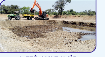
டிராக் வகை மண் அள்ளும் இயந்திரம்