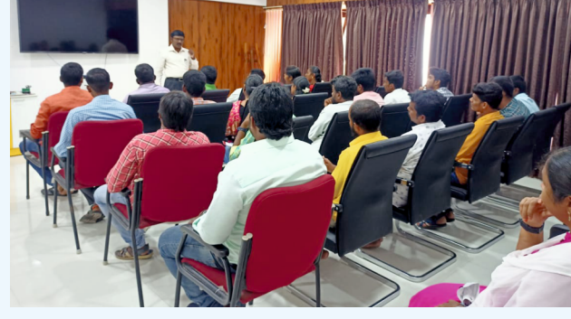
஁லி, ஁ளி ஁ரங்கில் பயிற்சி வகுப்பு