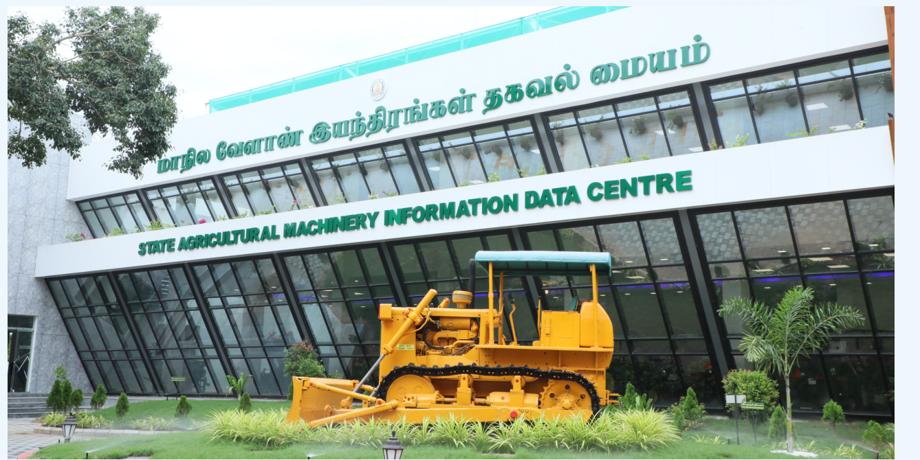
தலை஡ைப் பொறியாளர் (வே.பொ)