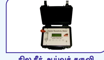
நில நீர் ஆய்வுக் கருவி