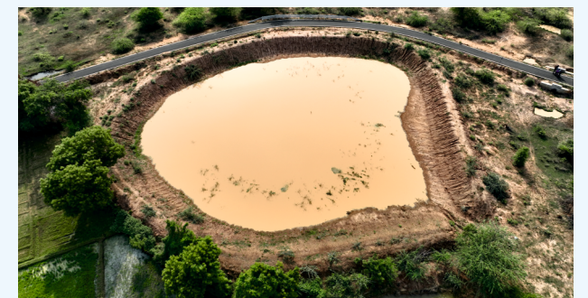
இனம் 4 - நீர் சேகரிப்பு கட்டமைப்புகளை தூர்வாரி மேம்படுத்துதல்