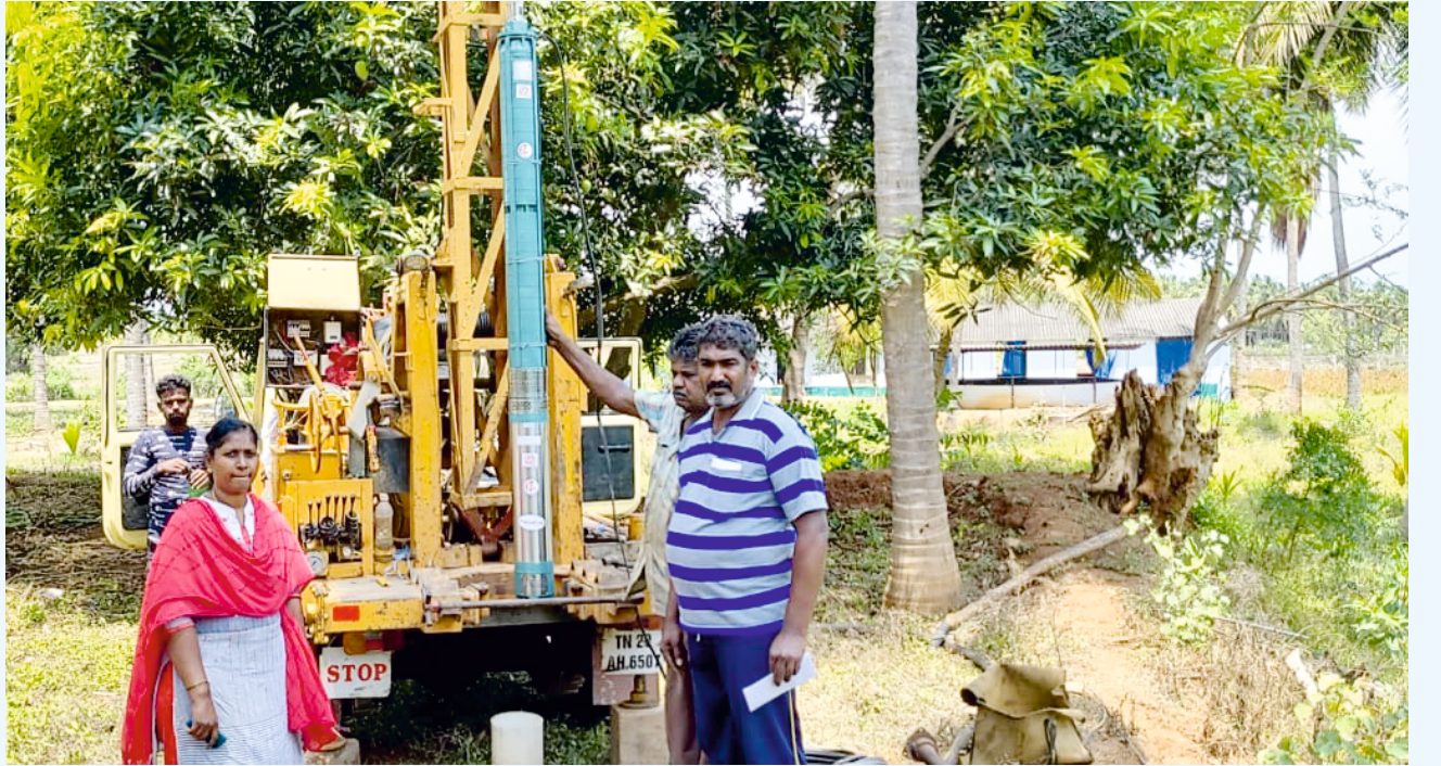
குழாய்/ஆழ்துளை கிணற்றில் நீர்மூழ்கி பம்பு செட்டு நிறுவதல்