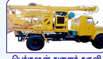
பொர்குஷன் துளைக் கருவி