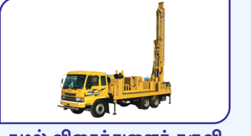
சுழல் விசைத்துளைக் கருவி