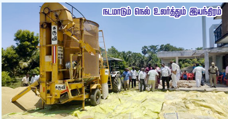
நடமாடும் நெல் உலர்த்தும் இயந்திரம்

டிராக்டரால் இயங்கும் 10 நடமாடும் நெல் உலர்த்தும் இயந்திரங்கள், ஒரு இயந்திரத்திற்கு அதிகபட்சம் ரூ.9 இலட்சம் என்ற வீதத்தில் ரூ.90 இலட்சம் மானியத்தில் தனிநபர் விவசாயிகள், விவசாய சுய உதவிக்குழுக்கள், விவசாய கூட்டுறவு சங்கங்கள், உழவர் உற்பத்தியாளர் அமைப்புகள், தொழில்முனைவோர்கள் ஆகியோருக்கு மானியத்தில் வழங்கப்படுகிறது.