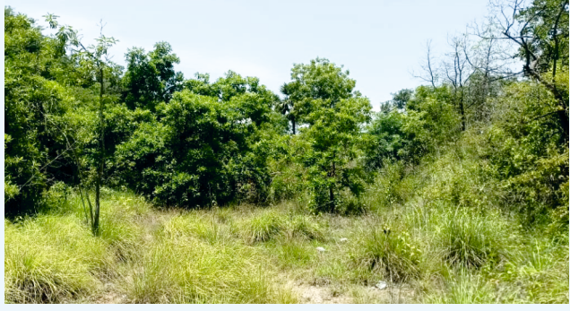
பராமரிப்பு பணி செய்வதற்கு முன்பு

அனைத்து மாவட்டங்கள் (தஞ்சாவூர், திருவாரூர், நாகப்பட்டினம், கன்னியாகுமரி மற்றும் நீலகிரி நீங்கலாக)