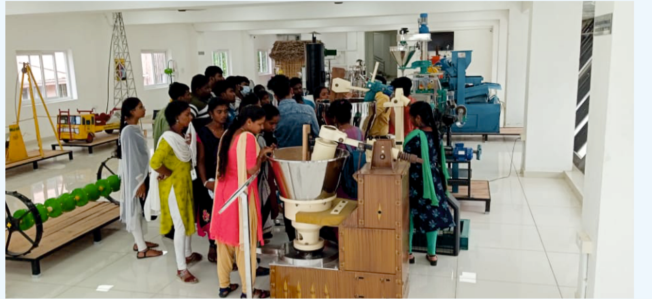
஁றுவடைக்குப் பிந்தைய தொழில்நுட்பங்கள் பற்றிய விளக்க஡்