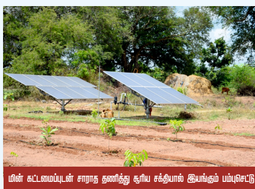
மின் கட்டமைப்புடன் சாராத தனித்து சூரிய சக்தியால் இயங்கும் பம்புசெட்டு

விவசாயிகள் நீர் பாசனத்திற்கான மின்சாரத் தேவையினை பெறுவதற்கு, முதலமைச்சரின் சூரிய சக்தி பம்புசெட்டுகள் திட்டத்தின்கீழ் மின் கட்டமைப்புடன் சாராத, தனித்து சூரிய சக்தியால் இயங்கும் பம்புசெட்டுகள் ஒன்றிய அரசின் வரையறுக்கப்பட்ட விலையில் அரசு மானியத்தில், வேளாண்மைப் பொறியியல் துறையின் மூலம் அமைக்கப்பட்டு வருகிறது.