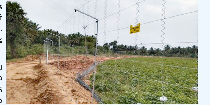
தொங்கும் சூரிய சக்தி மின்வேலி அமைப்பு