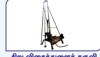
சிறு விசைத்துளைக் கருவி