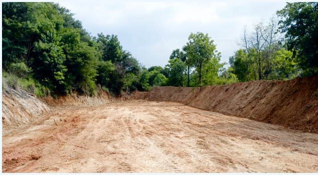
பராமரிப்பு பணி செய்த பின்னர்