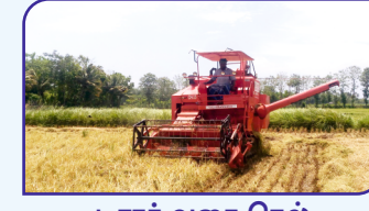
டிராக் வகை நெல் அறுவடை இயந்திரம்