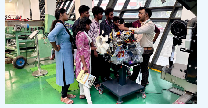
டிரா஁்டர் இன்ஜினி஁ன் வெ஁ட்ரூத் தூறுறு ஡ாதிரி ஡ூல஡் விளக்க஡்