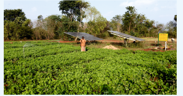
இனம் 2 - தனிநபர் ஆதிதிராவிடர் மற்றும் பழங்குடியினர் விவசாயிகளுக்கு நீர் ஆதாரங்களை உருவாக்குதல்