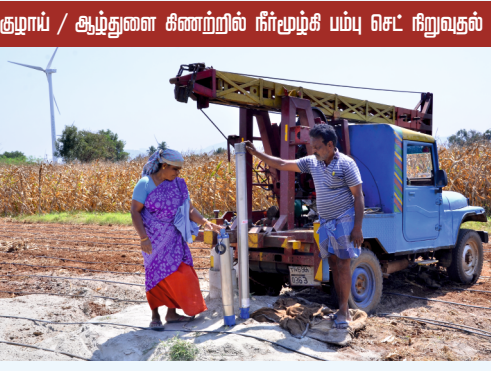
குழாய் / ஆழ்துளை கிணற்றில் நீர்மூழ்கி பம்பு செட்டு நிறுவதல்

இத்திட்டத்தில் பயன்பெற விரும்பும் விவசாயிகள் தாங்களாகவே உழவர் செயலி மூலமாகவோ https://play.google.com/store/apps/details?id=agri.tnagri&hl=en_IN&gl=US அல்லது நுண்ணீர் பாசன மேலாண்மை தகவல் அமைப்பு (MIMIS) என்ற இணையதளம் மூலமாகவோ http://tnhorticulture.tn.gov.in:8080/Subsidy/ApplySubsidy/ விண்ணப்பித்து தங்கள் பெயரை முன்பதிவு செய்து கொள்ளலாம்.