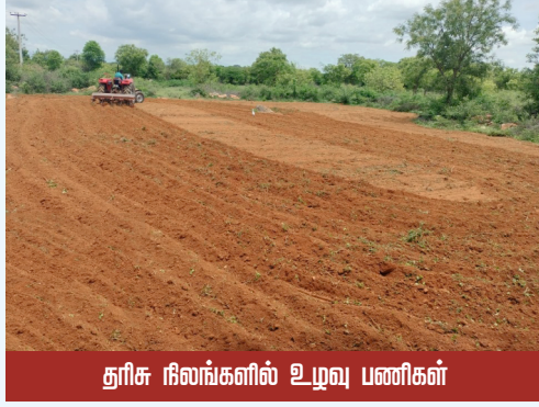
தூரிசு நிலங்களில் உழுவு பணிகள்