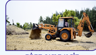
சக்கர வகை மண் அள்ளும் இயந்திரம்