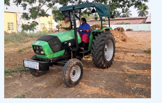
இரட்டைக் கட்டுப்பாட்டு வசதி கொண்ட டிராக்டர் (Dual Control Tractor) மூலம் பயிற்சி