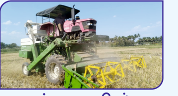
சக்கர வகை நெல் அறுவடை இயந்திரம்