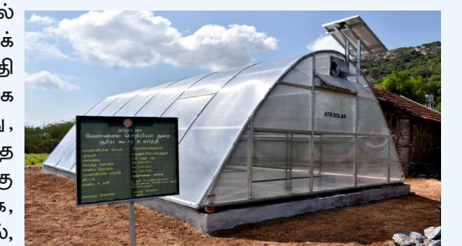
சூரிய கூடார உலர்த்தி

விவசாயிகள் விளைபொருட்களில் அறுவடைக்குப் பிறகு ஏற்படும் இழப்பினைக்குறைத்து, சூரிய சக்தியைப் பயன்படுத்தி சுகாதாரமான முறையில் மாசுபடாமல், விரைவாக உலரவைத்து தரத்தினை உறுதி செய்து, விளைபொருட்களின் இருப்பு காலத்தை அதிகரித்து, மதிப்பு கூட்டி அதிக விலைக்கு விற்பனை செய்து இலாபம் ஈட்டி ஏதுவாக, பாலிகார்பனேட் தகடுகள் வேய்ந்த பசுமை குடல், வகையிலான சூரிய கூடார உலர்த்திகள் விவசாயிகளுக்கு மானியத்துடன் வேளாண்மைப் பொறியியல் துறையின் மூலம் அமைத்துக் தரப்படுகிறது.