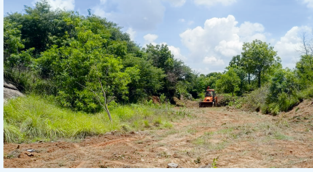
பராமரிப்பு பணி செய்யும் பொழுது