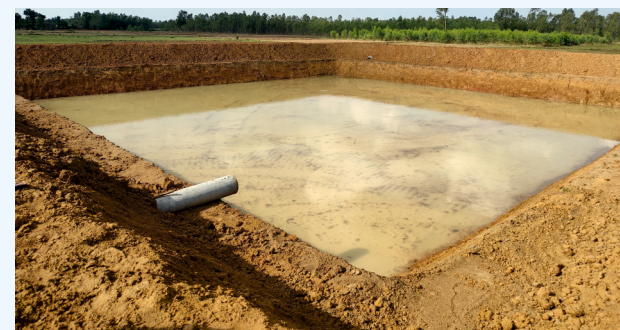
இனம் 3 - பண்ணைக்குட்டைகள் அமைத்தல்

அரசாணைகளில் குறிப்பிடப்பட்டுள்ள வழிகாட்டு நெறிமுறைகளின்படி, இத்திட்டத்தின் அனைத்து இனங்களும் 100% மானியத்தில் செயல்படுத்தப்படும்.